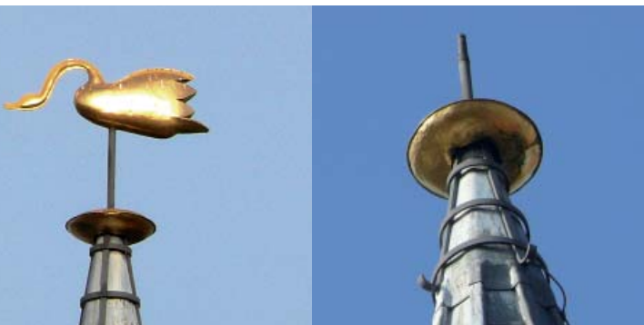
Zo is ie er...

De redactie behoudt zich het recht voor ingezonden artikelen in te korten of niet te plaatsen.