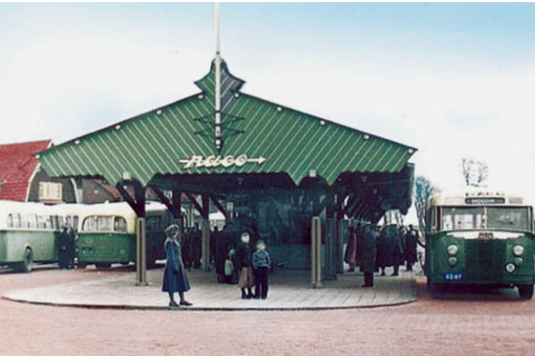
Uit de oude doos. Het busstation kort na de opening.

De herinrichting van het Tramplein is in volle gang. De kronkelbomen die in 1978 vanaf de Purmersteenweg zijn verplaatst naar de zogenoemde pannenkoek, waar voordien de Wilhelminaboom stond, zijn gekapt en het oude busstation is gesloopt. Fietsverkeer wordt omgeleid, maar auto's en bussen kunnen voorlopig nog de oude route volgen. Er wordt nu gewerkt aan de ondergrondse infrastructuur: pijpen, leidingen, kabels, enzovoort.